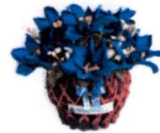
ตะกร้าเล็ก (10 x 12 ซม.) ราคา 200.- บาท