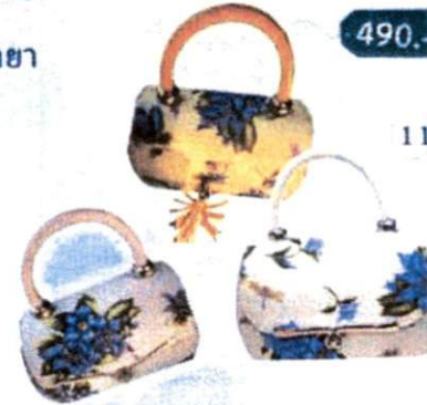
11. กระเป๋าถือลายดอกแก้วกัลยา (สีม่วง, สีครีม, สีเหลือง) 490.-