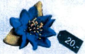
1. ดอกแก้วกัลยา (แบบเดี่ยว) 20.-

สำนักส่งเสริมอาชีพและพัฒนาดนพิการ สภาสังคมสงเคราะห์แห่งประเทศไทย ในพระบรมราชูปถัมภ์