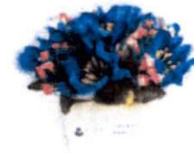
กระถางจิว (10 x 12 ซม.) ราคา 200.- บาท