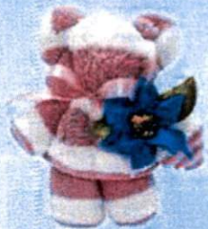
3. ตุ๊กตาหมีแก้วกัลยา (18x15 ซม.) 120.-