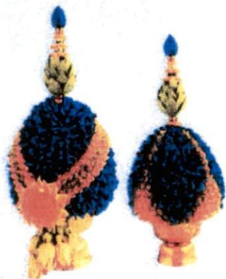
พานพุ่มใหญ่ (22 x 47 ซม.) ราคา 2,500.- บาท