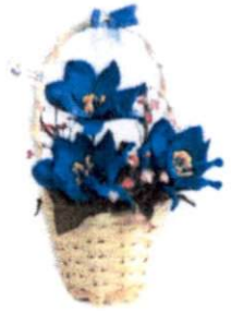
กระเช้าจิว (10 x 14 ซม.) ราคา 120.- บาท