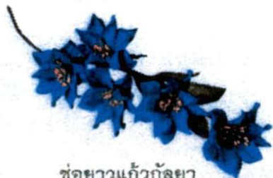
ช่อยาวแก้วกัลยา ราคา 120.- บาท