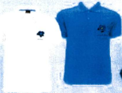
6. เสื้อยืดคอปกลายดอกแก้วกัลยา (แบบปัก) 350.-