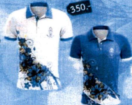
7. เสื้อยืดคอปกลายดอกแก้วกัลยา (แบบสกรีน Transfer) 350.-