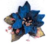
ดอกเดี่ยวมีดอกไม้แซม ราคา 50.- บาท