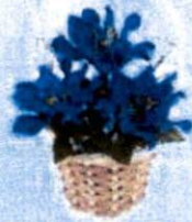
2. กระเช้าจิว (10x14 ซม.) 120.-