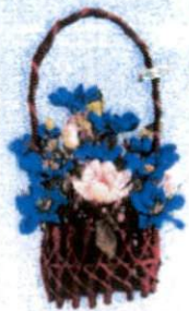
กระเช้าใหญ่ (20 x 28 ซม.) ราคา 450.- บาท