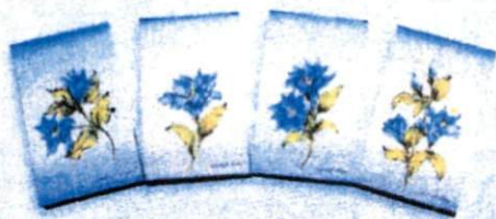
สมุดไม้ตแก้วกัลยา (9 x 15 ซม.) ราคา 55.- บาท