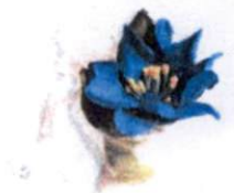
ยาหม่องแก้วกัลยา ราคา 45.- บาท