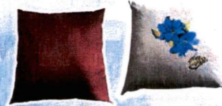
13. หมอนอิงลายดอกแก้วกัลยา 550.-

ติดต่อสั่งซื้อ / สอบถามเพิ่มเติม โทร : 02-354-7533-37