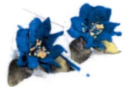
ปากกาแก้วกัลยา ราคา 30.- บาท