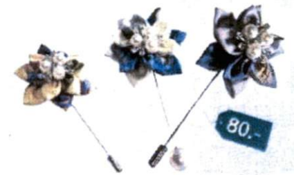
12. เข็มกลัดดอกแก้วกัลยาแบบผ้า (สีม่วง, สีครีม, สีเหลือง) 80.-