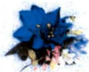
แม่ก้นไม้แก้วกัลยา ราคา 75.- บาท