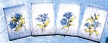
4. สมุดโน้ตแก้วกัลยา (9x15 ซม.) 55.-