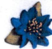
ดอกเดี่ยว ราคา 20.- บาท